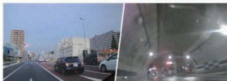
夕暮れでも鮮明な映像