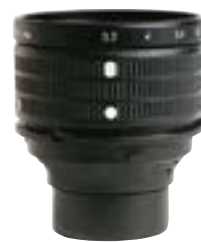
エッジ 50 オプティック 4961607 471418