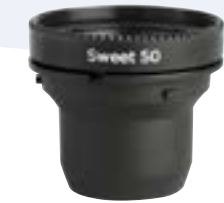
スウィート 50 オプティック 4961607 859889