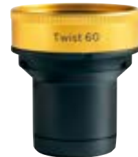
Twist60 オプティック 4961607 471227