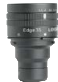
エッジ 35 オプティック 4961607 472767