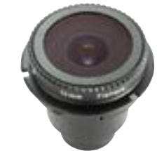
フィッシュアイ オプティック 0188772 002665