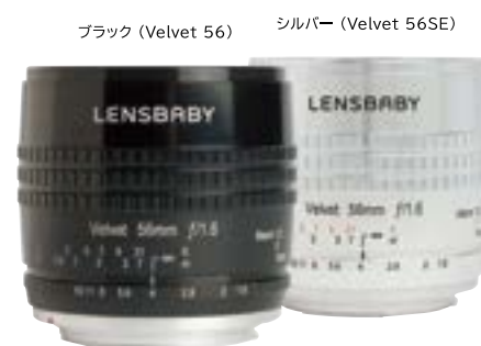
ブラック (Velvet 56) シルバー (Velvet 56SE)

オープン価格 ※製品写真および仕様はキヤノン EF マウントのものです。マウントにより製品仕様が異なります。