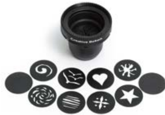
クリエイティブボケ オプティック 4961607 471746