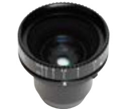
スウィート 35 オプティック 0188772 003082