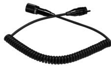
スパイラルケーブル 2m