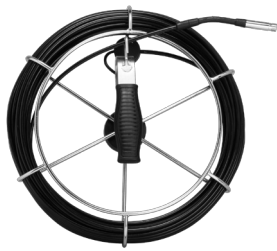
スプール付きフレキシブルチューブ 20m