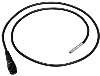
フレキシブルチューブ 約1m