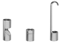
ミラー、マグネット、フック (アタッチメント)