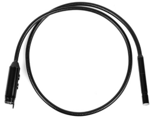
ピント調整機能付きフレキシブルチューブ 1m